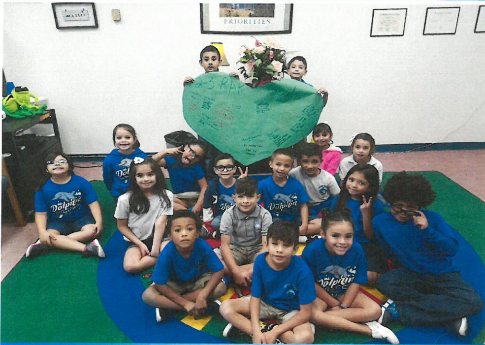
La Escuela Dolphin Terrace Elem. presenta objetivos de bodad en la clase.

Los consejeros de YISD comienzan el año con Actos de Bondad y Amabilidad